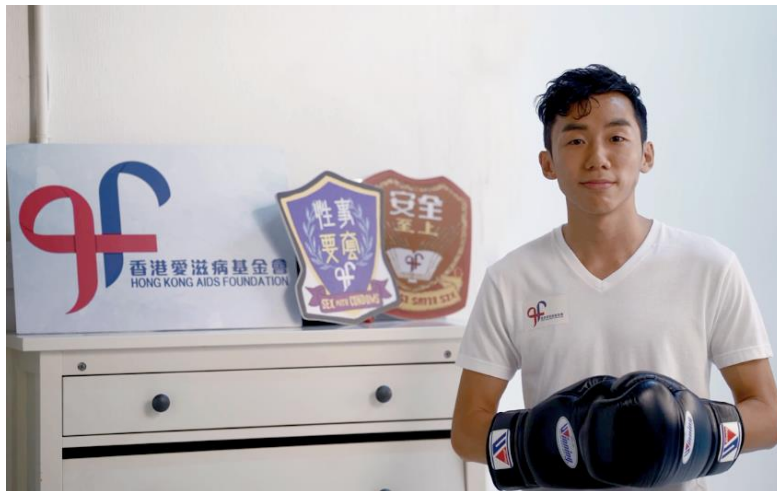
著名拳击运动员曹星如先生为新一季「Love with Sextitude」广告进行拍摄

有见及此，基金会将加强公众教育的工作。为进一步宣传基金会的爱滋病预防及教育工作，基金会于今年 6 月已展开全新一辑以「Love with Sextitude」为主题的广告硬照及宣传短片拍摄工作，重点为宣扬每个人都应该以负责任的态度看待性行为，及早接受测试，并把爱滋病病毒抗体测试纳入恒常的身体检查范畴，提升市民对性健康的关注。